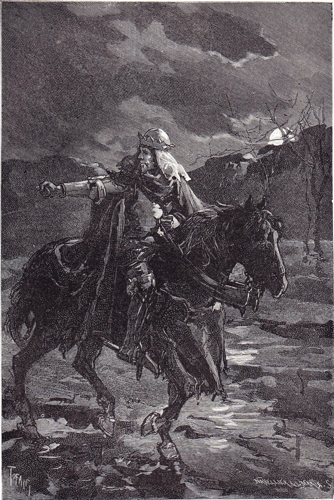
AINSI S'EN VA LE ROI PÉDRO TOUT SEUL (CHAP. XL)